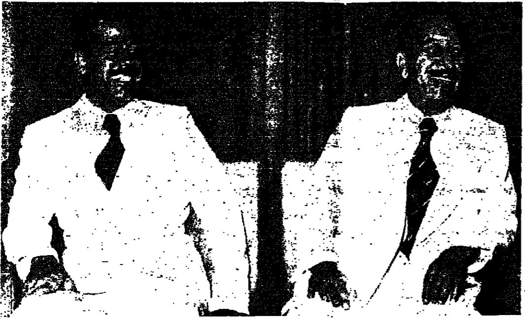
الرئيس العراقي البكر والسيد صدام حسين نائب رئيس مجلس الثورة

افتتح أمس في البصرة جنوب العراق، عدد من المشروعات البترولية من بينها مشروع المرحلة الثالثة من مشروع الرملة الشمالي.